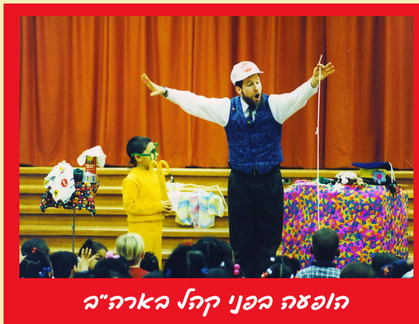
חופע בפני קהל הארה"ה