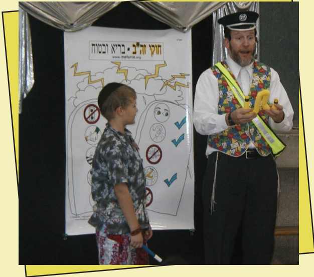
לילדים מגיל ארבע עד כיתה ו' ומשפחותיהם